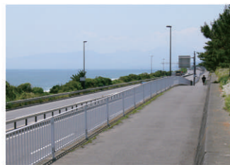
5 太平洋岸自転車道(千葉~和歌山)