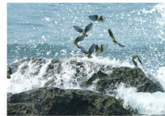
8 アオバト集団飛来地