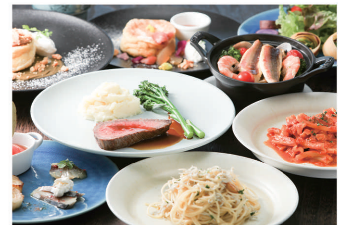
大磯港賑わい交流施設(OISO CONNECT) 2階 レストラン