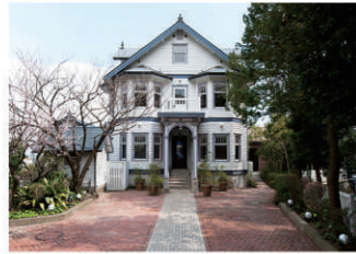
2 旧木下家別邸(大磯迎賓館)