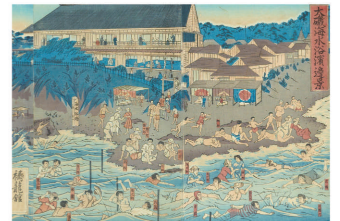
「禰龍館(とうりゅうかん) 繁栄之図」(部分) 明治24年