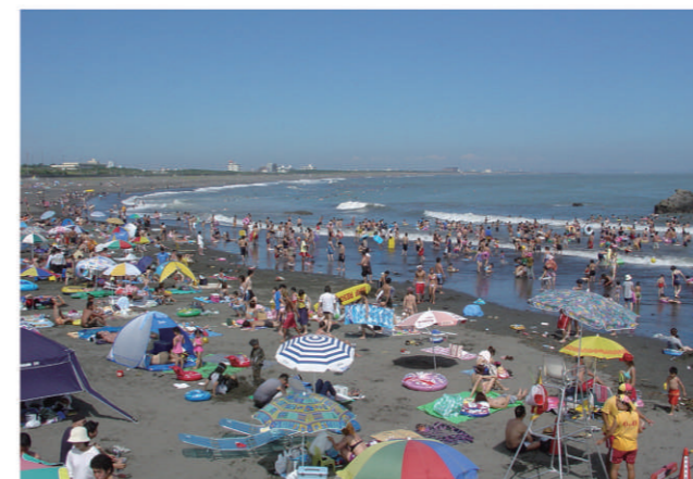
大磯海水浴場(北浜海岸)