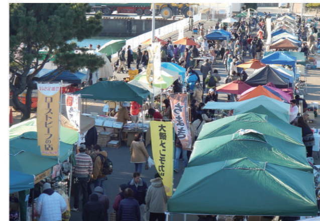
大磯市 (毎月第3日曜日に開催)