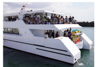
17 ビジターバス(クルージング)