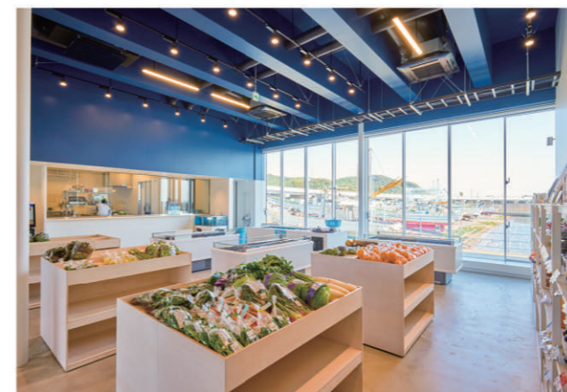
大磯港賑わい交流施設(OISO CONNECT) 1階 直売所