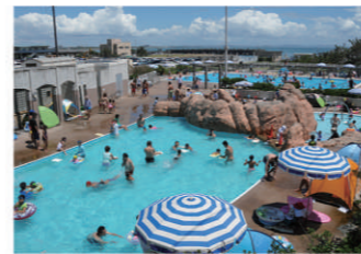
9 ポートハウステるがさき