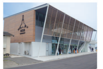
15 大磯港賑わい交流施設